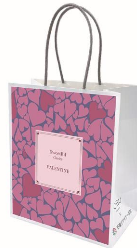
ショッパーの完成イメージ

当店の店長や担当者に向けて、デザインのコンセプトやデザインに込めた想いをプレゼンしました。プレゼンでの得点をもとに選考を行い、採用デザインが決定しました。