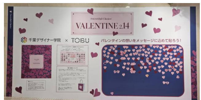
メッセージボード