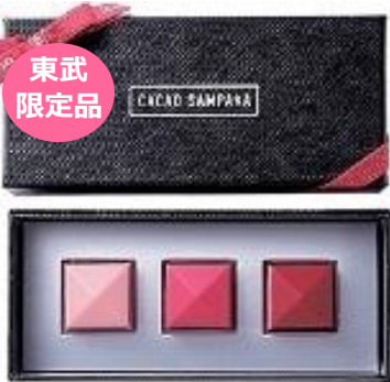
【カカオサンバカ】 「ルナ セレクション3種」