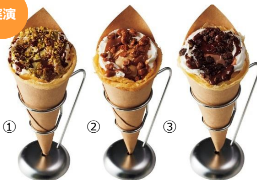
【バビ】「クレープ」 ①ドバイチョコレート②塩キャラメルダブルナッツ ③プラリネチョコレート

イートイン 各1,650円(1個) モチモチ食感のクレープ生地に、ジェラートや生クリーム、BABBI特製のソースをトッピング。この期間、関東では池袋東武でしか味わえないスイーツです。