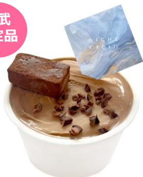
【ナイトカカオバイココディー】 「70%ダークチョコジェラート」 イートイン 693円(1個)《数量限定》

70%ダークチョコを使ったリッチな味わいのジェラートにカットした生チョコをトッピング。 ※生チョコトッピングは先着500名様限定