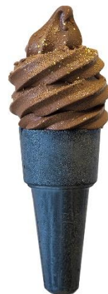
【アンフィニ】 「チョコレートソフト」 イートイン 770円(1個) 加賀金沢の森八が手がけるショコラトリエ。和と洋をかけ合わせた複雑で繊細な味わいのソフトクリーム。

本格ショコラと、ソフトクリームでは珍しいチョコミントの2種。生チョコと割チョコで仕上げは贅沢に。