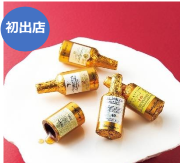
【アンソンバーグ】 「アンソンバーグウイスキー コレクション5P」

1,998円(5個入) ※アルコール使用 シングルトン、ダルウィニー、オーバン、タリスカー、ラガヴァリン。世界的に有名なウイスキー5種をダークチョコに閉じ込めました。