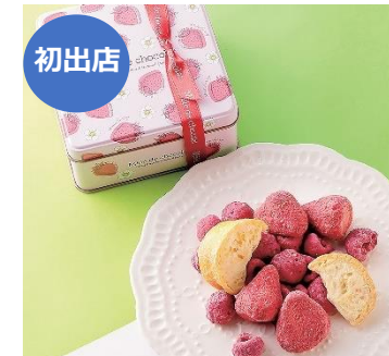
【メレド・ショコラ】 「メリメロ ベリーベリー ラヴィアン」

2,700円(105g) フリーズドライのフルーツにチョコを染み込ませた新食感ショコラ。ストロベリー、ラズベリー、青島みかんの3種をアソート。