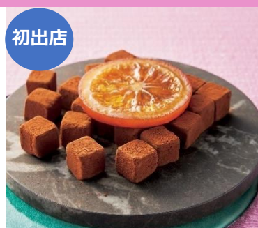
【メゾン・ショードン】

みずみずしいゴールドドレーズをボルドー産の貴腐ワインでマリネし、ピターチョコで包みました。