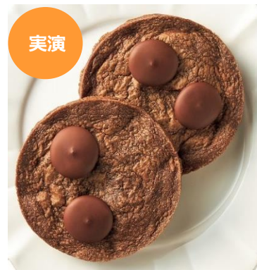
【ブノワ・ニアン】 「クッキー オ モルソー ド ショコラ」 864円(1個) 店内で焼き上げる出来たての自家製クッキー。こだわりのチョコや発酵バターでくちどけの良い食感に。