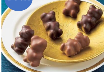
【クルイゼル】 「クルイゼル ギモーヴヘア」