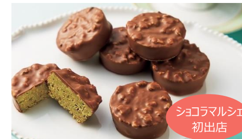
【ピスタアンドトーキョー】

カカオの香り豊かなショコラ、甘くてほろ苦いショコラ キャラメルなど4種の詰合せ。