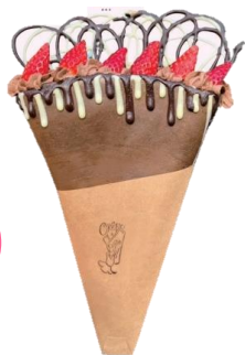
【クレープとエスプレッソと】 「ストロベリーショコラダブルメルト」 1,600円(1個)

香り高いショコラ生地にミルキーな生クリーム、ラズベリージャム、チョコクッキーを入れ、上には自家製の甘さ控えめなチョコクリームと国産のイチゴ。ホワイトチョコとミルクチョコをダブルでメルトした贅沢な一品。