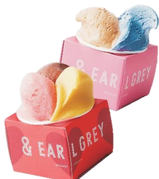
【&アールグレイ】 「香るティージェラート」 イートイン 825円(トリプル)715円(ダブル) ショコラ フランボワーズやヘーゼルナッツキャラメルなど、2026年バレンタイン限定チョコジェラート4種が登場。