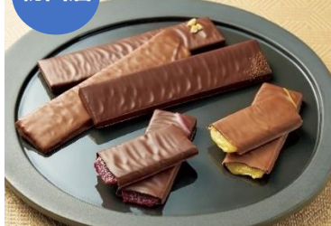
【メゾン・ルルー】 「キャラメルバー5本セットA」