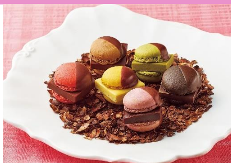
【ソイルチョコレート&amp;