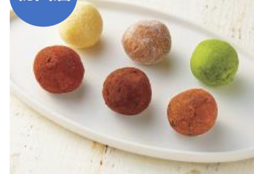
【ダリケー】 「カカオが香るチョコレート・トリュフ-shizuku-」