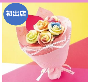
【メサージュ ド ローズ バイ カレンド】

複数ブレンドしたビター系クーベルチュールをベースに、オレンジのテイストをプラスした柑橘の香り高いパヴェ。