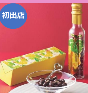
【メゾン・ヴェルディエ】