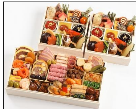
【京都 三千院の里&マノワール】 個食+オードブル ¥16,200 カウントダウン用オードブルとお正月の個食おせち。 約1人前×2+オードブル 重箱：木製 15.9×15.9×高さ5cm×2、15.9×31.9×高さ5cm