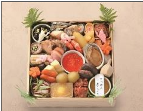
【京料理 美濃吉】一段 ¥32,400 京料理文化を継承する老舗自慢の味を堪能。 約1~2人前 重箱：木製 21.9×21.9×高さ5.7cm