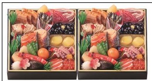
【京・料亭 わらびの里】