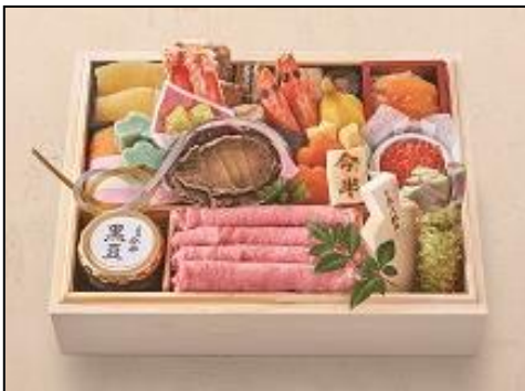
【人形町今半】匠おせち一段 ¥27,000 牛肉料理専門店が仕上げたおせちで年賀の宴を優雅に。 約2人前 重箱：木製 21.5×28×高さ5.8cm