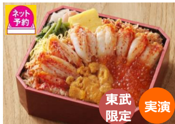
鱈幸食品 ※9月10日(木)~16日(水) 花咲ガニ贅沢盛弁当 旬の道産花咲ガニとイクラなどが 贅沢にのったお弁当。 2,700円