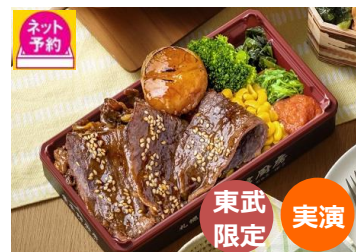
豊平館厨房 ※9月17日(木)~22日(火・祝) 昆布熟成十勝和牛セコンドステーキと 道産牛ジューシーカルビ大粒帆立弁当 十勝和牛モモのステーキと道産牛カルビ、 大粒の道産天然帆立がのったお弁当。 2,268円

北海道の海鮮と言ったら、鮭や蟹がおすすめです。おうちごはんや家で飲む機会が増えた今の時期にぴったりなごはんやお酒との相性が良い逸品を取り揃えています。