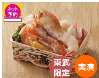
肴や一蓮 蔵 ※9月10日(木)~16日(水) 特大ボタン海老と赤縞海老の特盛弁当 旬の道産特大ボタン海老と 赤縞海老のコラボレーション弁当。 2,700円

まるで北海道で食べているかのような鮮度の高い海鮮を使ったお弁当を6店舗で展開します。今回は、今が旬の道産ボタン海老や花咲ガニを使用した海鮮弁当がイチオシです。また、道産のお肉を使用したボリューム感ある肉弁当を2店舗で展開します。