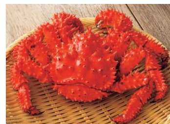
札幌蟹販 ポイル花咲ガニ 旬の道産花咲ガニを 丸ごと一杯販売。 2,700円から(1杯/約400gあたり)