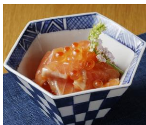
佐藤水産 時鮭ルイベ漬 道産の鮭とイクラを使った ルイベ漬。 1,620円(50g)