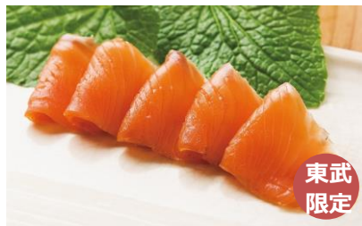
鮭乃丸亀 時不知のスモークサーモン 昭和十年から続く鮭乃丸亀の 道産鮭の燻製スライス。 1,620円(100g)

北海道の海鮮と言ったら、鮭や蟹がおすすめです。おうちごはんや家で飲む機会が増えた今の時期にぴったりなごはんやお酒との相性が良い逸品を取り揃えています。