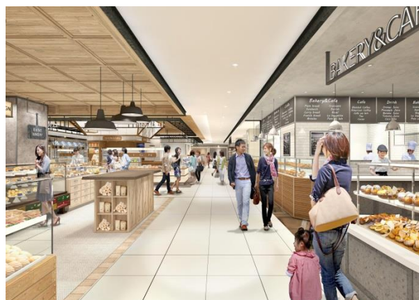
↑ 地下1階8～11番地 食品売場 イメージ