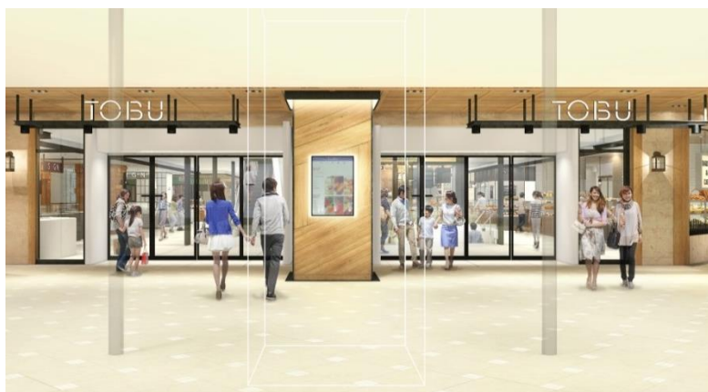
↑ 地下1階8番地 メインエントランス イメージ

※出店ショップの詳細等につきましては今後のリリースにてお伝えします。(次回は8/末～9/初を予定)