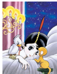
少女マンガ雑誌「なかよし」に連載された「エンゼルの丘」の版画

会場に等身大鉄腕アトム(身長 135cm)がやってくるよ。写真を撮って SNS にアップしよう!