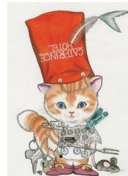
知人ぞ知る「キャットプリンス」の版画も展示します