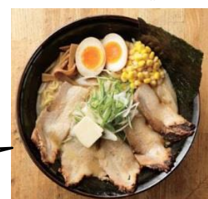
↑信玄の豪華 550円ラーメン

<各日抽選による当選者のみ限定 55杯> 55周年特別企画として作られた信玄の超豪華東武限定ラーメンを、各日55名の当選者だけが550円で食べることが出来る抽選会を実施します。(抽選方法など詳細未定) ※5月4日(木)から