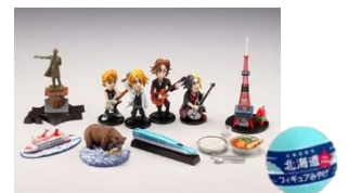
↑北海道フィギュアみやげシリーズ

新千歳空港ほか北海道地区限定で設置されているカプセルトイが初登場。北海道のさまざまな名物を精巧にフィギュア化したカプセルフィギュア「北海道フィギュアみやげ」シリーズの BEST 版となる「北海道フィギュアみやげ ALL STARS」を会場内の休憩スペースに設置します。