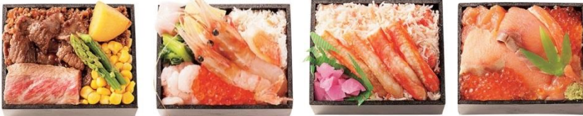
左から)豊平館厨房、肴や一蓮 蔵、札幌かに工房、佐藤水産鮭

実施期間:4月27日(木)から5月9日(火) ※5月4日(木)からは店舗・内容を一部変更して販売 ※豊平館厨房はお一人様1点限り