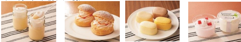
左から)フランドリス、とみたメロンハウス、プティ・メルヴィュー、スイートオーケストラ

実施日:4月27日(木)、4月28日(金)、 5月1日(月)、5月2日(火)、5月8日(月)、5月9日(火) ※5月9日(火)のみ午後5時から