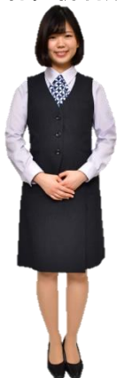
↑ 一般(雑貨・衣料品・リビング)用制服