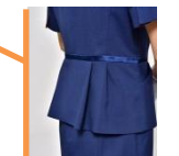
ジャケットの裾が広がったデザイン