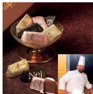
↑ シルヴィオ・ベッソーネ