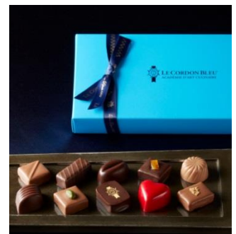
↑ ル・コルドン・ブルー