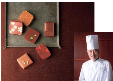
↑ ショコラティエ パレド オール

美味しさと品質を閉じ込めた証“封蝋”を模したチョコレートがアクセント。シャンパーニュを練り込んだ新作のほか、フランボワーズ、山椒のボンボンショコラの3種が味わえる池袋東武限定アソートです。