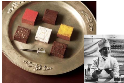
↑ MAMANO～神様のチョコレート～