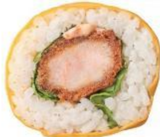
↑ 重吉「タルタルエビカツ君」