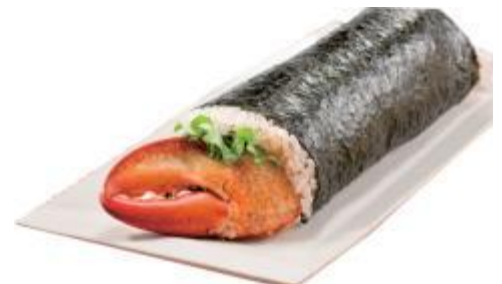
↑ 北辰館「たらばがに・オマールエビ巻」