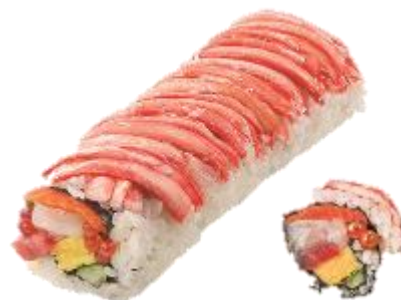
←関山 「招運海鮮七福巻」