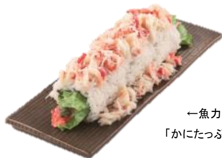
←魚力 「かにたっぷり巻」