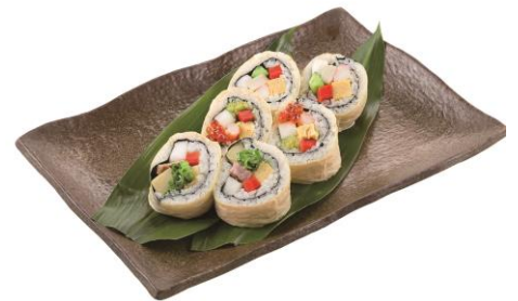
↑ 美濃吉「料理屋の山海招福巻」