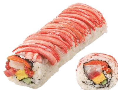
←関山 「招運海鮮七福巻」