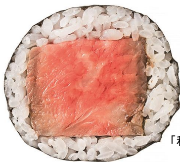
←キッチンズギモト 「和牛熟成肉ステーキ恵方巻」