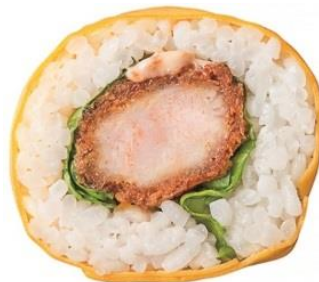
↑ 重吉「タルタルエビカツ君」