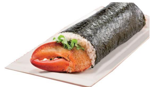
↑ 北辰館「たらばがに・オマールエビ巻」