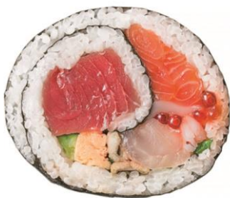
↑ 北辰館「大間・鮭児ハーフ巻」