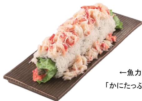
←魚力 「かにたっぷり巻」