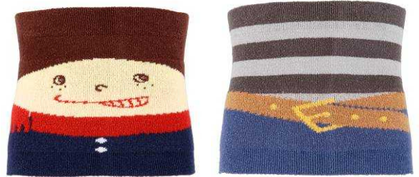
↑ユニーク柄も登場(11月上旬入荷予定) ↑見せてもおしゃれなベルト柄