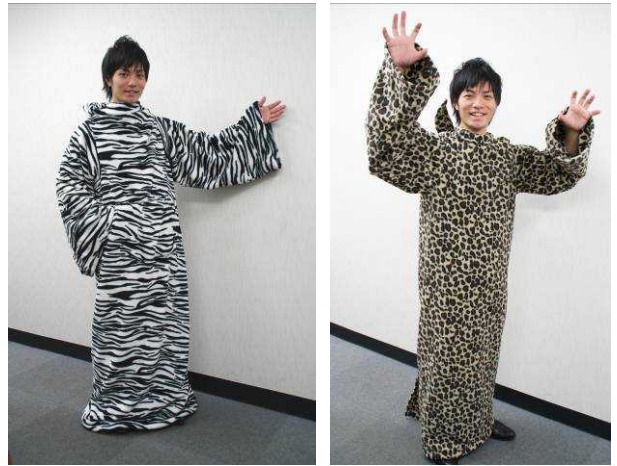
おうちで過ごす休日に最適な“着る毛布”