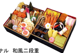
東武オリジナル 和風二段重