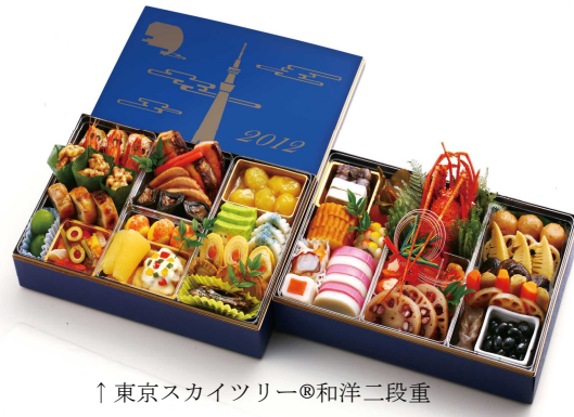
↑ 東京スカイツリー®和洋二段重

2012年5月22日に開業する「東京スカイツリー」の誕生を祝し、特別なお重をご用意しました。東武でしか味わえない、歡びにみちた祝い膳です。青空に迫力いっぱいの東京スカイツリーが描かれた風呂敷に包んでお渡します。東京スカイツリーロゴマークにある7色の日本の伝統色を美しい食材で和洋折衷に盛り付けました。