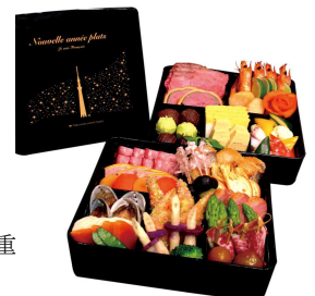
東京スカイツリー®洋風二段重