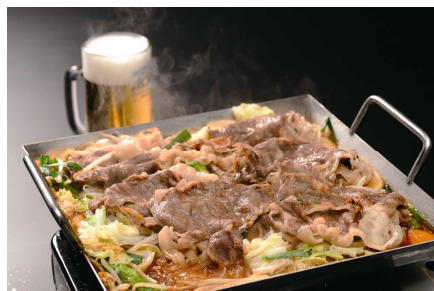
お肉と相性抜群の自家製ダレを使用