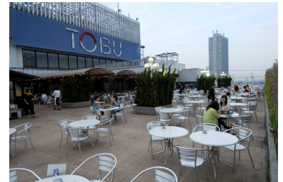
ビアガーデン会場(日中)

近年、アウトドア感覚でビアガーデンを楽しまれるお客様が増加傾向にあり、お子様連れのご家族や女性同士が目立つようになりました。そこで、東武百貨店池袋店レストラン街スパイスでは、ビアガーデン営業開始日を昨年より2週間早め、5月21日(金)からスタートします。また、夏休み期間限定で初の試みとしてランチ営業を行い、更なる新規顧客獲得を目指します。